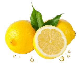
ODEUR DE CITRON